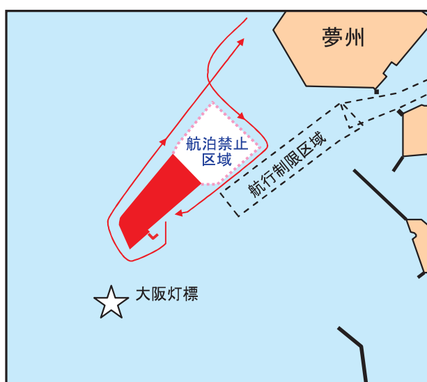
和歌山基地からの運航ルート