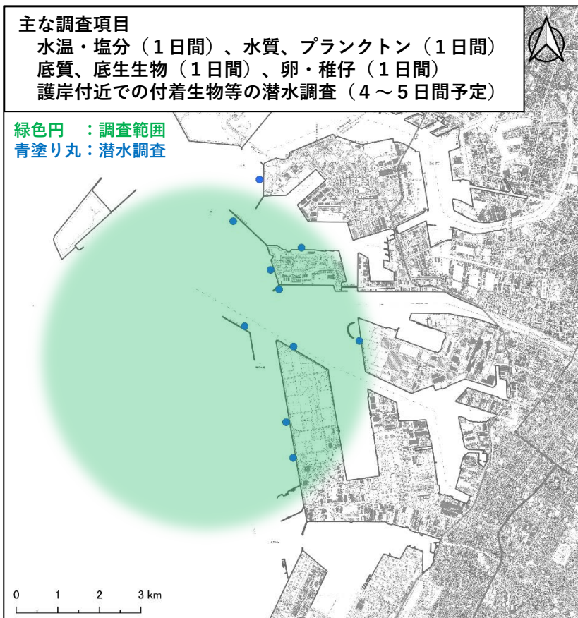
位置図は国土地理院1/25000地形図を使用